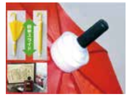
文部科学大臣発明奨励賞受賞 傘カパー「あっぱれ」

【問合せ先】 明石市産業振興財団 企業支援係 (TEL 078-936-7917)