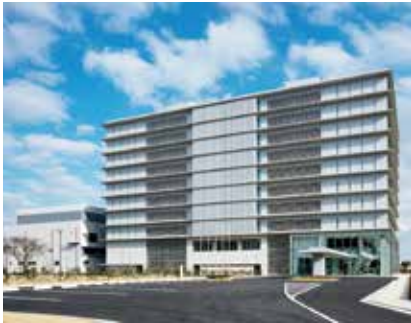
明石工場 総合事務所棟

A： 当社の起源は、1878年に東京築地に開設した川崎造船所です。その3年後には、神戸に川崎兵庫造船所を開設しました。そして、1896年に株式会社に改組し船舶だけではなく機関車、貨客車、橋桁など幅広い事業へ展開しました。航空機事業にも着手し、飛行機部門が分離してできた川崎航空機工業株式会社が、1940年に明石工場を開設しました。当初は、航空機の専門工場としての出発でしたが、現在は、技術開発部門、二輪車、汎用エンジン、産業用ロボット、航空用/船舶用/産業用ガスタービンエンジンなど、それぞれに業界屈指の技術をもって幅広い製品群を送り出す川崎重工の主力工場の一つです。