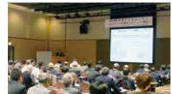
平成26年度開催風景

【同時開催】 技術シーズ・県内産業支援機関の活動紹介のポスター展示 13:00~17:00