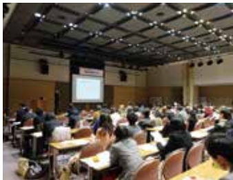
平成26年度開催風景