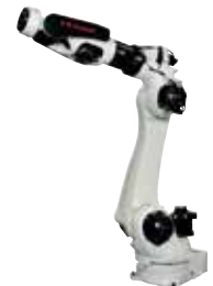
スポット溶接用ロボット (BX100L)

ロボットビジネスセンターは、日本における産業用ロボットの先駆者として40年以上に及ぶ経験と実績を有しています。一歩先を行く高性能なロボットは勿論のこと、高度なシステムエンジニアリング技術とホスピタリティの精神を持って、高度化、多様化する生産設備のトータルソリューションを提供しています。